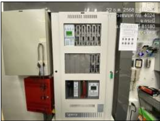
Fire Alarm Control