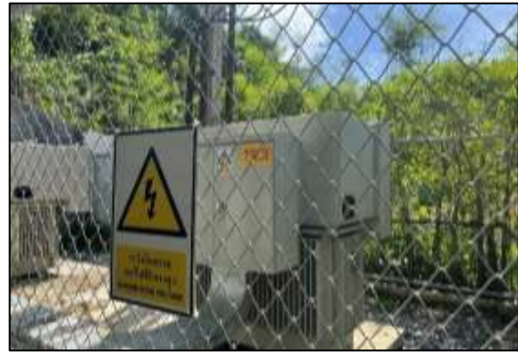
หม้อแปลงไฟฟ้า TR 3-4