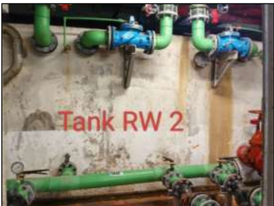
ถังเก็บน้ำดิบของโครงการ