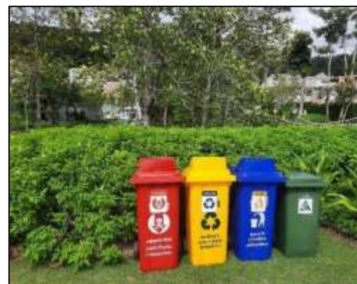
ถังขยะ 4 ประเภท บริเวณพื้นที่ส่วนกลาง