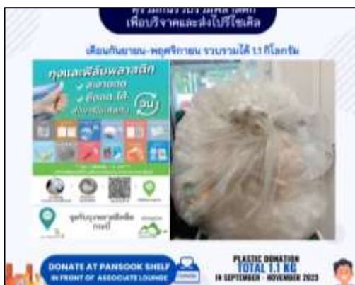
Application รณรงค์เรื่องการจัดการขยะ