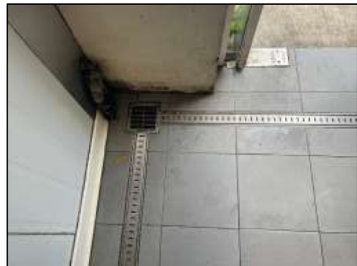
ท่อรับน้ำจากห้องพักขยะไปยังระบบบำบัดน้ำเสีย