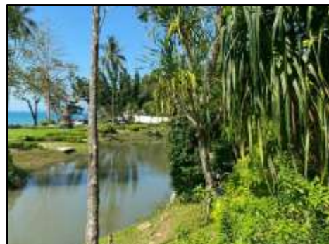
ภาพที่ 2-1 พื้นที่สีเขียวภายในโครงการ