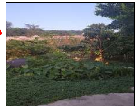
ภาพที่ 2-1 ระบายน้ำฝนของโครงการ