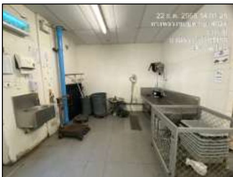
ห้องพักขยะรวม