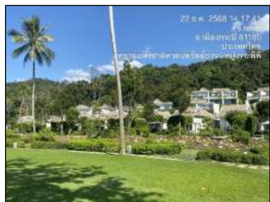
โครงการเลือกใช้วัสดุสีอ่อน และจัดให้มีพื้นที่สีเขียว