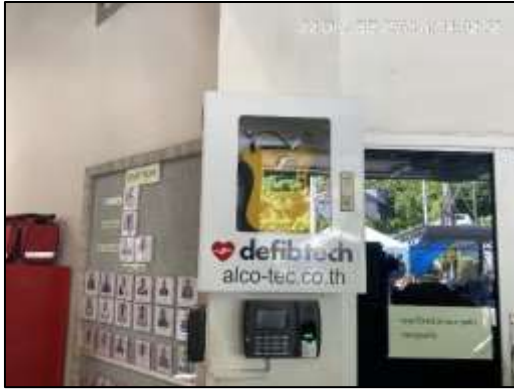
เครื่องกระตุ้นหัวใจ AED และเครื่องช่วยหายใจ