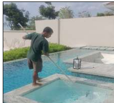
ทำความสะอาดสระว่ายน้ำโครงการ