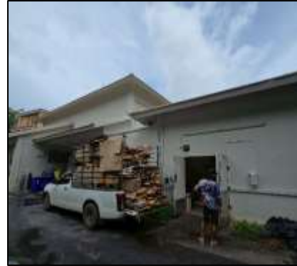
การขนย้ายขยะออกจากโครงการ