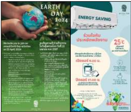
Application ธรณรงค์เรื่องการประหยัดพลังงาน