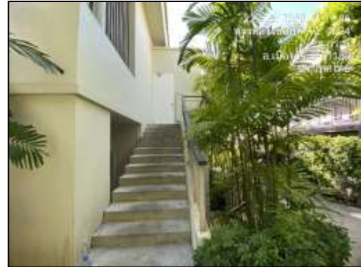
ภาพที่ 2-27 ระเบียงและราวกันตก