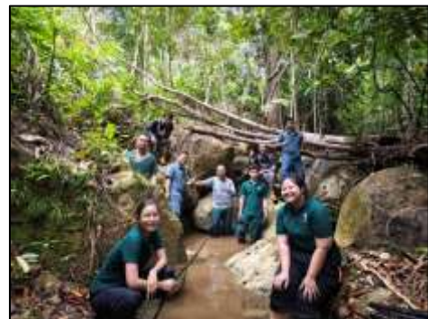
ภาพที่ 2-20 กิจกรรมการลอกคลองส่งน้ำเข้าสู่ห้วยทับแขก