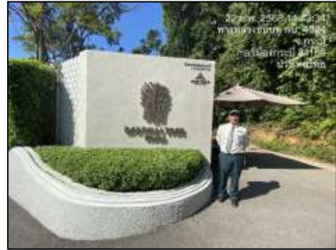
ภาพที่ 2-13 การรักษาความปลอดภัยของโครงการ