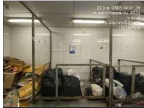
ห้องพักขยะทั่วไป