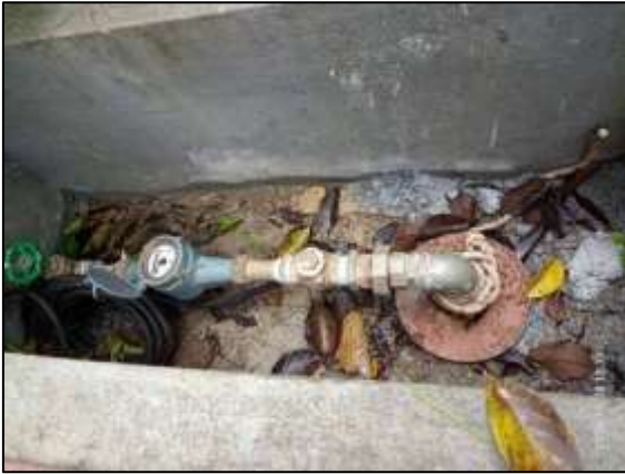
ที่สูบน้ำใต้ดิน (บ่อ 1 )