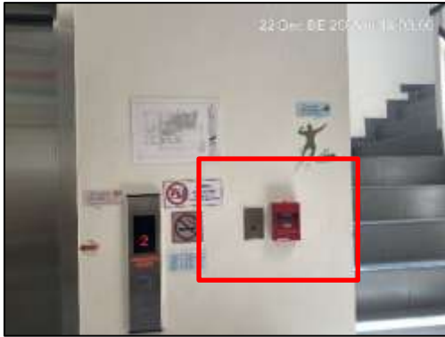
Telephone Jack และ Manual Station