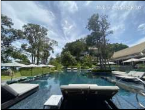
ทางเดินรอบ ๆ สระว่ายน้ำ