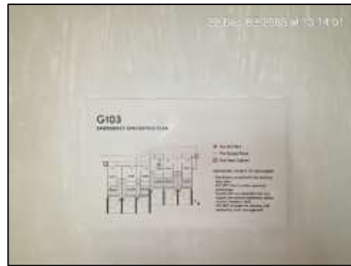
ผังเส้นทางหนีไฟภายในห้องพัก