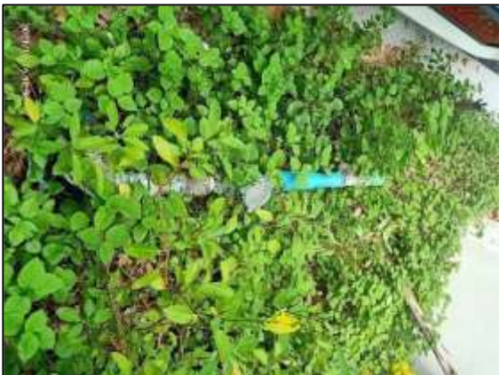
ที่สูบน้ำใต้ดิน (บ่อ 3 )