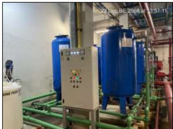
ระบบกรองน้ำของโครงการ