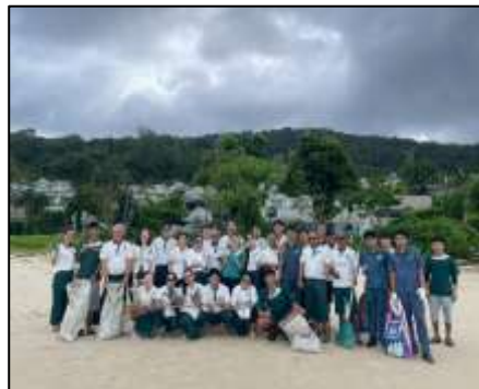
ภาพที่ 2-12 เจ้าหน้าที่ทำความสะอาดหาดทับแขก