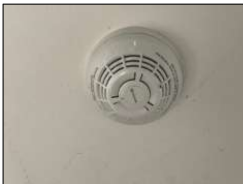
Rate of Rise Heat Detector