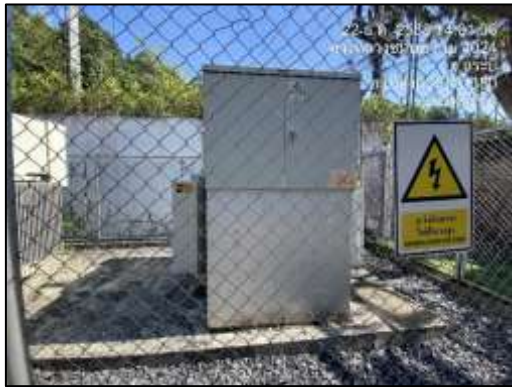
หม้อแปลงไฟฟ้า TR 1-2