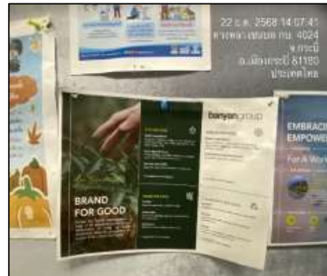
ภาพที่ 2-28 การรณรงค์และประชาสัมพันธ์ต่าง ๆ