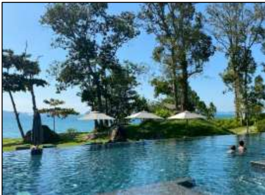
สระว่ายน้ำของโครงการ