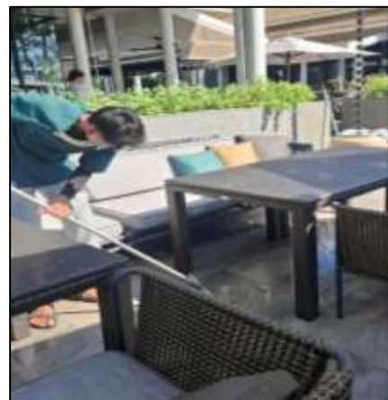
ภาพที่ 2-29 การทำความสะอาดพื้นที่โครงการ