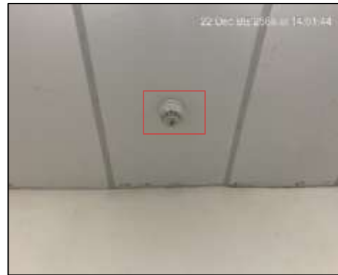
Smoke Detection Addressable