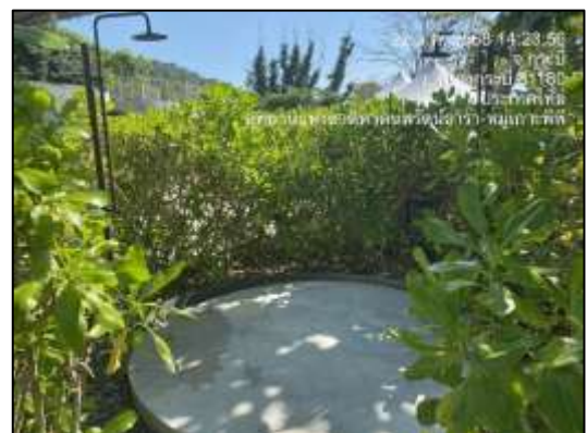
ที่ล้างตัวก่อนและหลังการใช้สระว่ายน้ำ