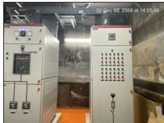
Main Distribution Board : MDB และ Circuit Breaker : CB