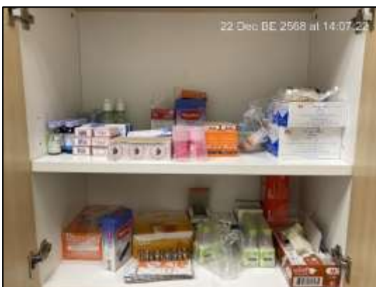
อุปกรณ์ปฐมพยาบาลเบื้องต้น