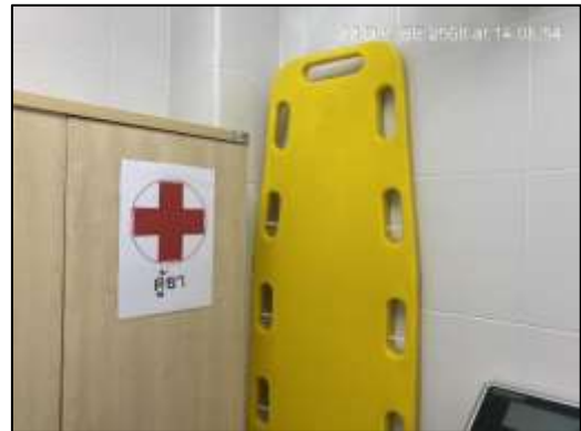
ห้องปฐมพยาบาลเบื้องต้น