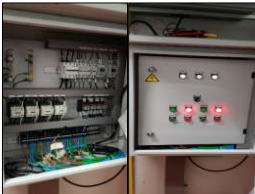
ระบบเปิด-ปิด ไฟพื้นที่ส่วนกลาง