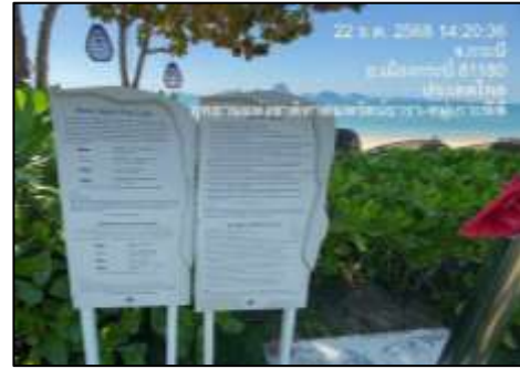
ป้ายบอกให้หนีภัยขึ้นที่สูง