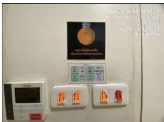
ป้ายรณรงค์ประหยัดพลังงานของเจ้าหน้าที่