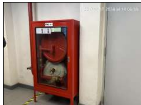
Fire Alarm Cabinet