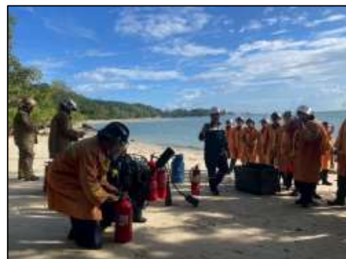
การซ้อมดับเพลิง (ประจำปี 2568)