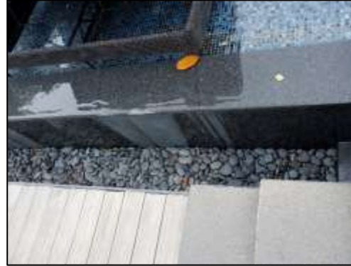
รางระบายน้ำฝน