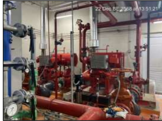
ปั๊มสูบน้ำดับเพลิง