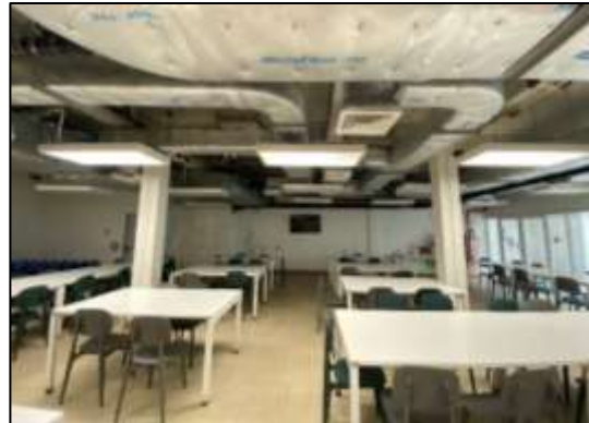
ภาพที่ 2-25 การจัดการร้านอาหารภายในโครงการ