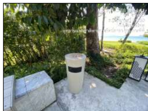
ถังขยะบริเวณโครงการฯ