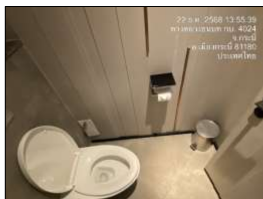
ถังขยะในห้องน้ำ