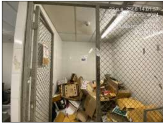
ห้องพักขยะรีไซเคิล