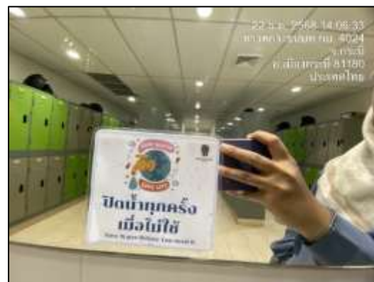
ป้ายรณรงค์ประหยัดน้ำในส่วนของพนักงาน