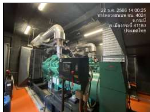
เครื่องกำเนิดไฟฟ้าสำรอง