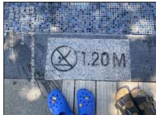
ป้ายบอกระดับความลึก