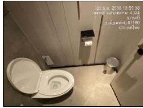
สุขภัณฑ์ประหยัดน้ำภายในโครงการ