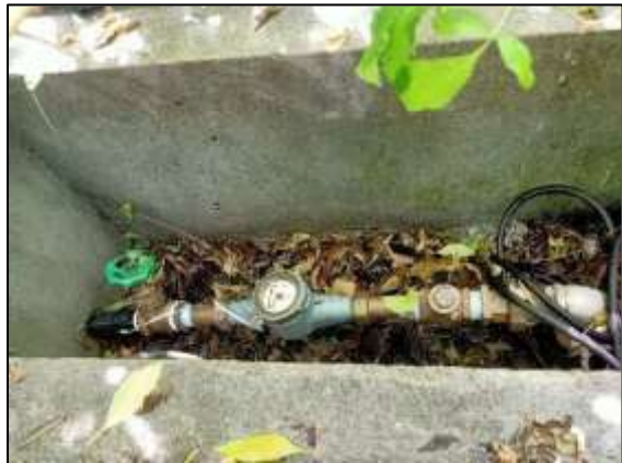
ที่สูบน้ำใต้ดิน (บ่อ 4 )