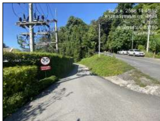
ภาพที่ 2-17 ถนนคอนกรีตที่ได้รับอนุญาตให้ปรับปรุง