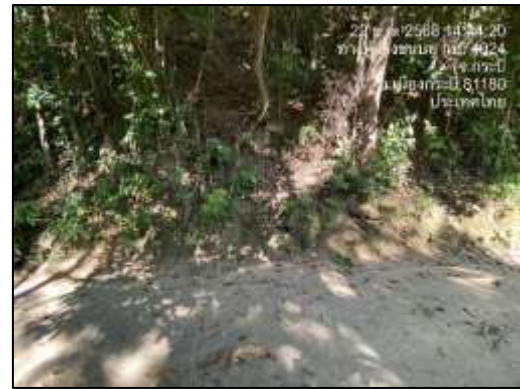
ภาพที่ 2-7 ลักษณะรั้วต้นไม้ตามแนวเขตที่ดิน