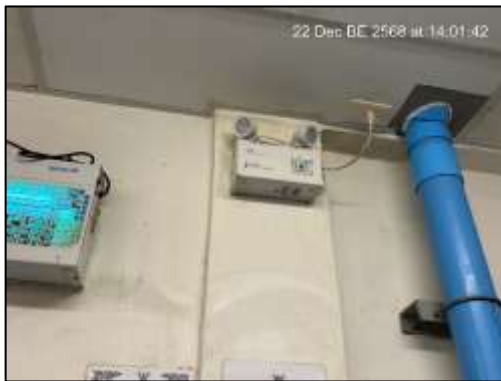
ไฟฟ้าส่องสว่างฉุกเฉิน