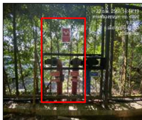
ท่อรับน้ำดับเพลิง

ภาพที่ 2-22 (ต่อ) ระบบระบบป้องกันและแจ้งเตือนอัคคีภัยของโครงการ