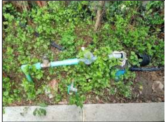
ที่สูบน้ำใต้ดิน (บ่อ 2 )