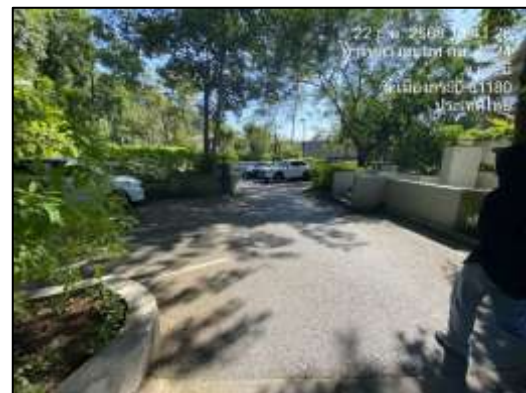
ภาพที่ 2-15 ที่จอดรถภายในโครงการ