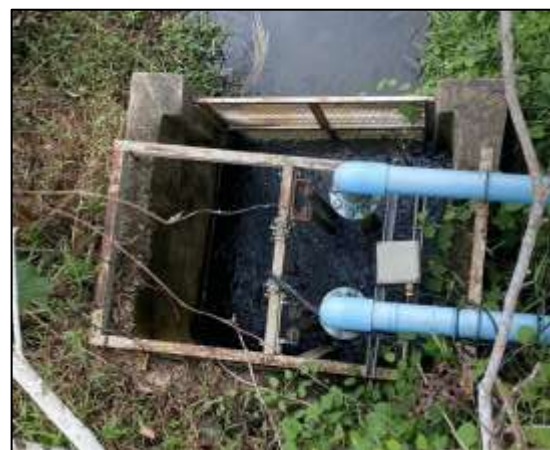
จุดสูบน้ำจากห้วยทับแขก