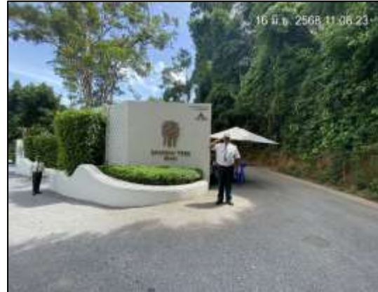
ภาพที่ 2-16 ป้ายชื่อโครงการที่สามารถมองเห็นได้แต่ไกล