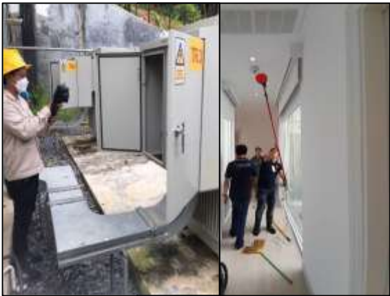
เจ้าหน้าที่ตรวจสอบหม้อแปลงไฟฟ้าและไฟฟ้าส่วนกลาง