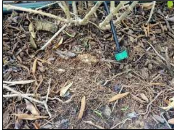
ระบบน้ำหยดที่ใช้น้ำทิ้งที่ผ่านการบำบัดมารดน้ำต้นไม้