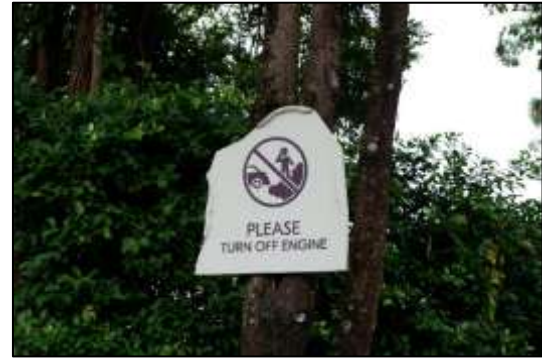
ภาพที่ 2-4 ป้ายจอดรถกรุณาดับเครื่องยนต์