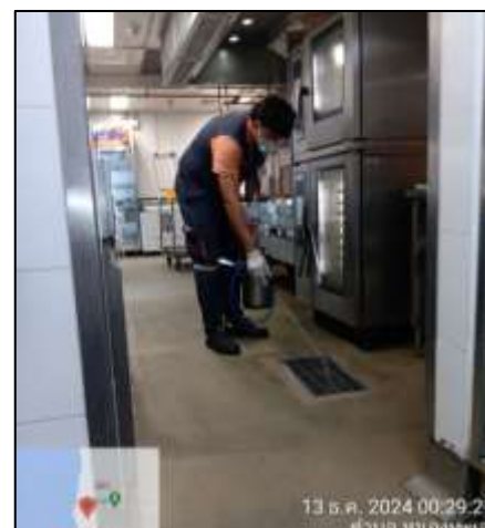
ภาพที่ 2-26 เจ้าหน้าที่ฉีดพ่นกำจัดยุง (ประจำปี 2567)