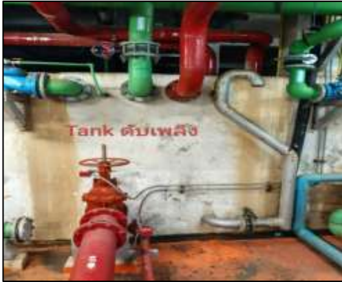
ถังสำรองน้ำดับเพลิง