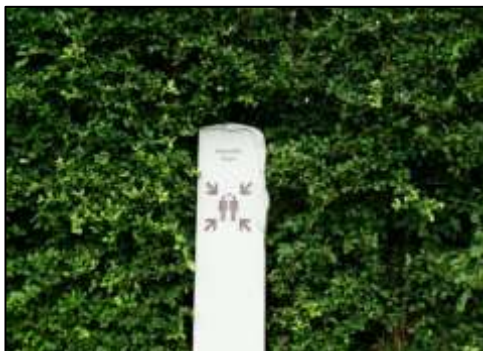
จุดรวมพล