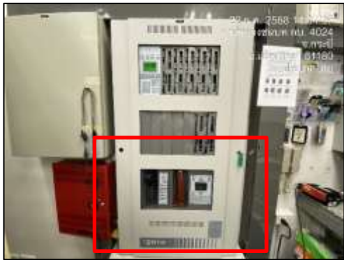
Fire Alarm Speaker