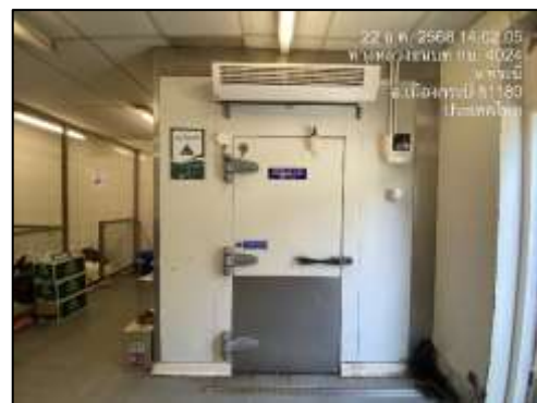
ห้องพักขยะเปียก (เป็นห้องเย็น)