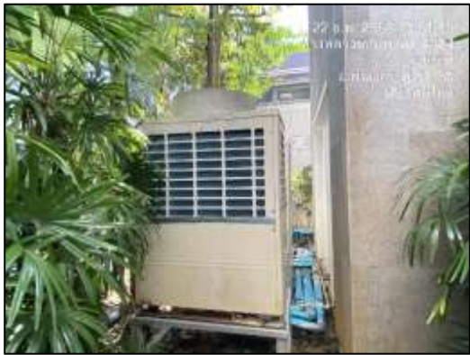
ระบบเครื่องปรับอากาศแบบ VRF