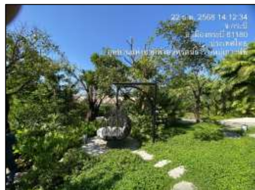
ภาพที่ 2-1 (ต่อ) พื้นที่สีเขียวภายในโครงการ