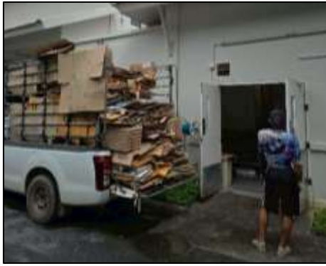
การคัดแยกขยะรีไซเคิล