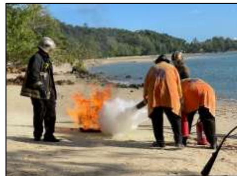
การซ้อมดับเพลิง (ประจำปี 2568)

ภาพที่ 2-3 ป้ายบอกเส้นทางหนีภัย จุดรวมพล และซ้อมดับเพลิงประจำปี