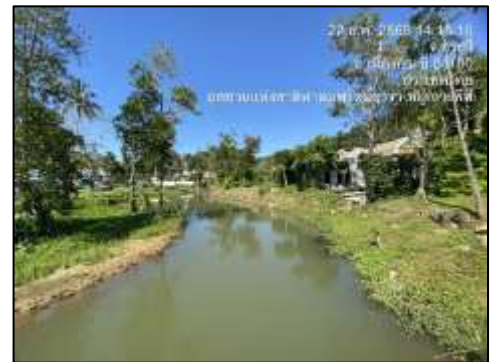
บริเวณห้วยทับแขกที่ไหลผ่านโครงการ