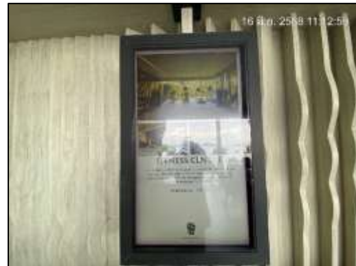
ภาพที่ 2-8 ประชาสัมพันธ์แหล่งท่องเที่ยวใกล้กับโครงการ