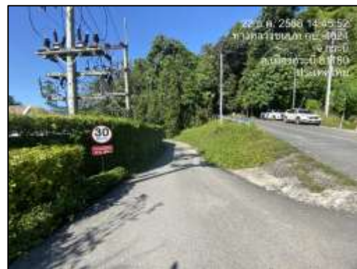
ป้ายจำกัดความเร็ว ไม่เกิน 30 กม./ชม. บริเวณถนนทางเข้าโครงการ