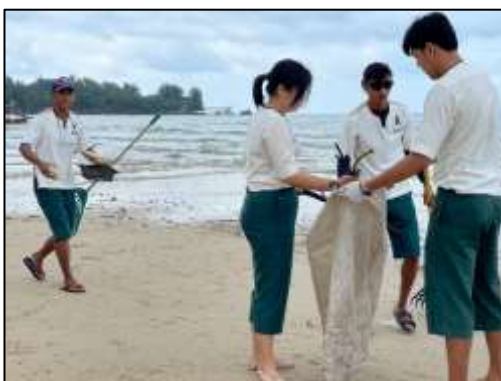
เก็บขยะบริเวณชายหาดรอบโครงการฯ