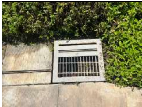
วางระบายน้ำ