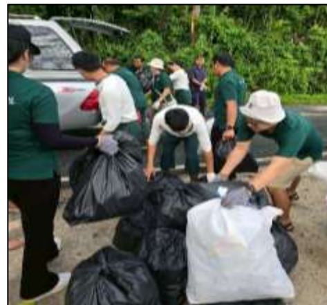
ภาพที่ 2-30 กิจกรรมเพื่อสังคม