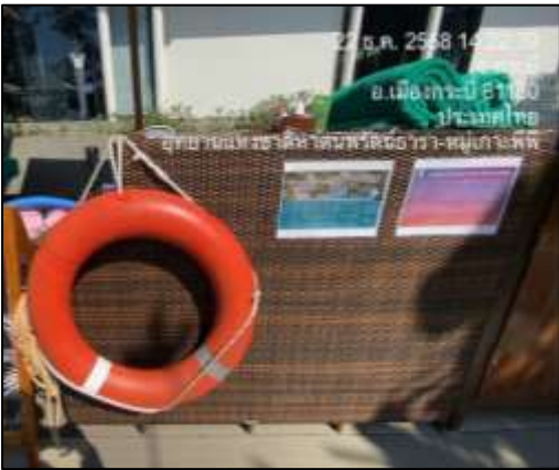
ห่วงชูชีพ