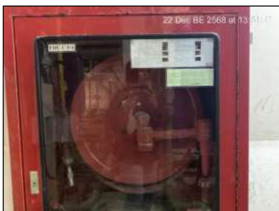
ป้ายแนะนำวิธีการใช้อุปกรณ์ดับเพลิง