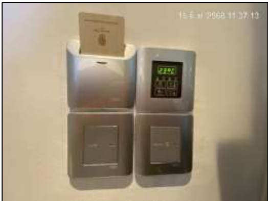
ระบบ KEY CARD ควบคุมไฟฟ้าในห้องพัก