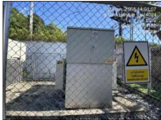
ป้ายเตือนอันตรายไฟฟ้าแรงสูงที่บริเวณหม้อแปลงและห้องเครื่องไฟฟ้า