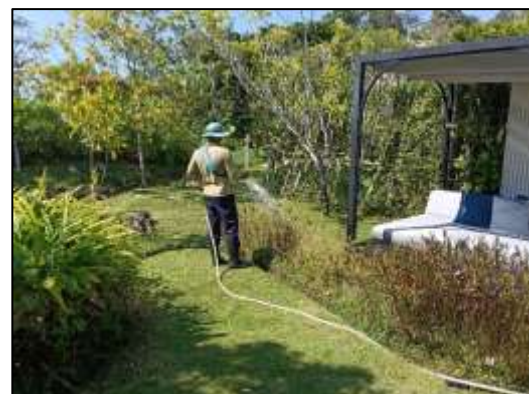
ภาพที่ 2-6 เจ้าหน้าที่ดูแลพื้นที่สีเขียว