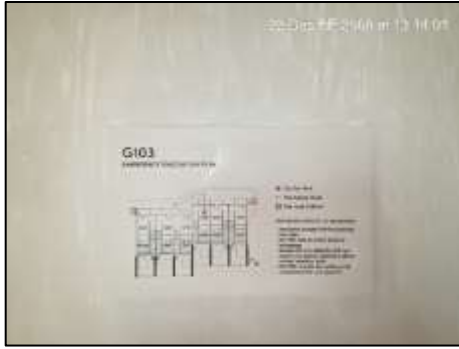
แผนผังการหนีไฟ