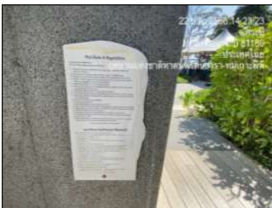
ระเบียบข้อบังคับการใช้สระว่ายน้ำ