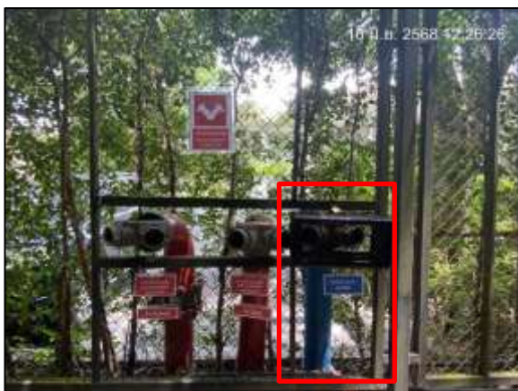
หัวรับน้ำใช้จากบริษัทเอกชน